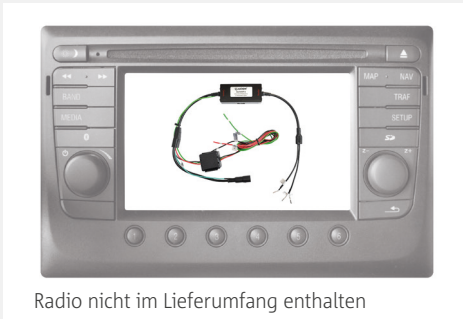
Radio nicht im Lieferumfang enthalten

Kameraanbindung an das DAF TNR LKW Navigationsradio