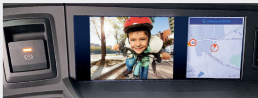
MAN Mediasystem Navigation Professional 12,3 Zoll