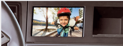
MAN Mediasystem Navigation Advanced 7 Zoll

Plug & Play Adaptionen an MAN Mediasystem Advanced & Professional zum Anschluss von AXION Kameras